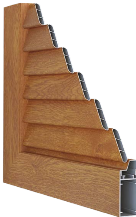
Foto: Súkromný dom