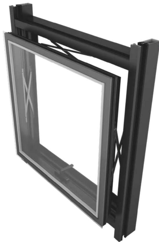
Návrh: Aedas CE, Varšava Zhotoviteľ hliníka: Al-Bud Sp. z o.o., Wołomin